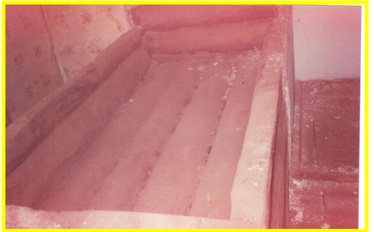
Русская печь (разборка)